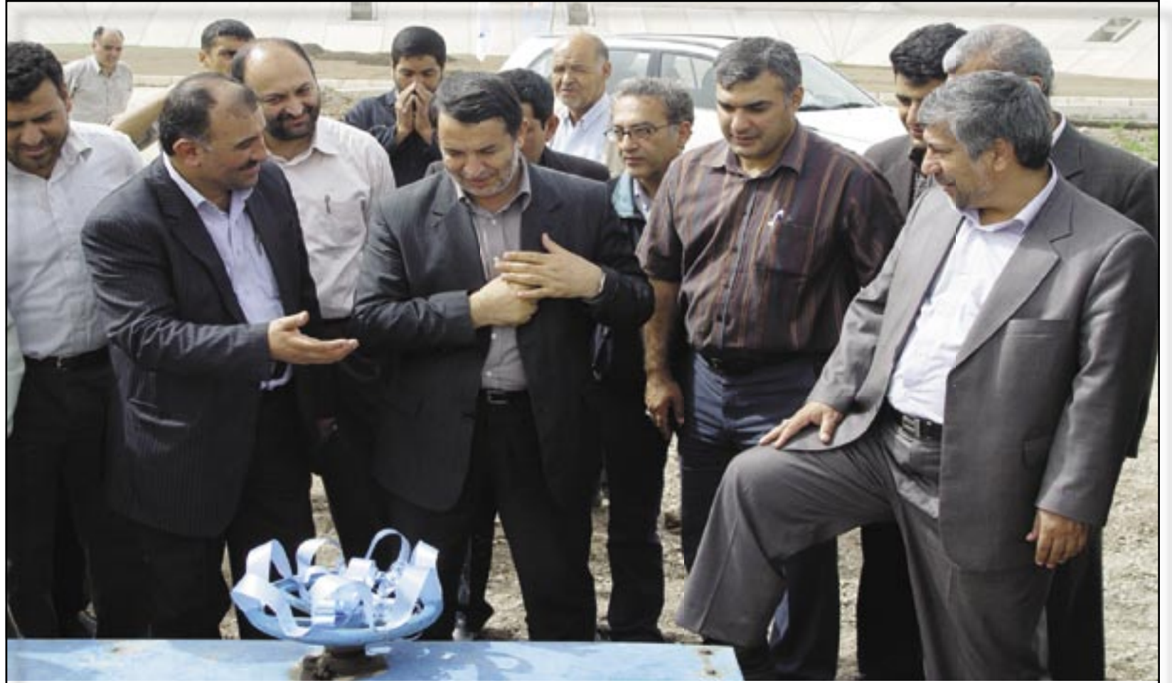
بازدید معاون امور آب و آبفای وزارت نیرو و مدیر عامل شرکت مهندسی آب و فاضلاب کشور از تصفیه خانه فاضلاب استان قزوین

سالانه بالغ بر ۱۵ هزار اشتراک به مشترکین تحت پوشش فاضلاب شرکت افزوده می شود